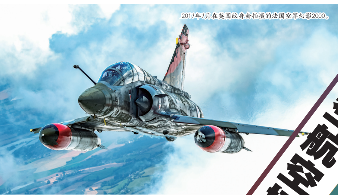
2017年7月在英国纹身会拍摄的法国空军幻影2000。