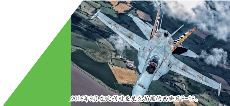
2016年9月在比利时圣尼克拍摄的西班牙F-18。