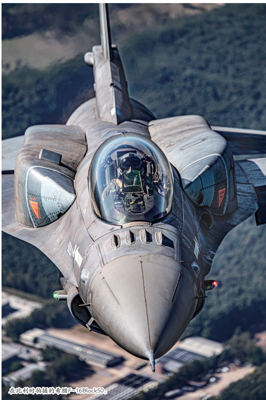
在比利时拍摄的希腊F-16Block50。