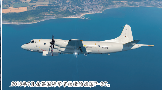
2018年7月在美国海军节拍摄的德国P-3C。