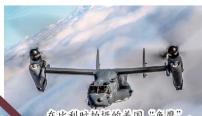
在比利时拍摄的美“鱼鹰”。