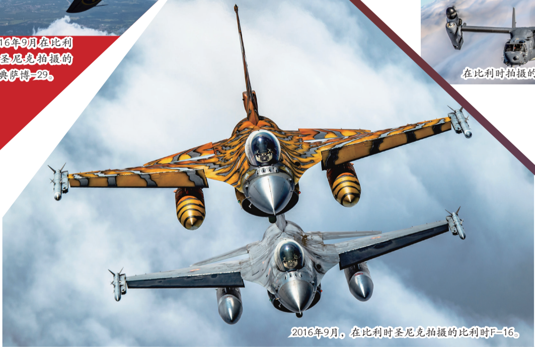
2016年9月，在比利时圣尼克拍摄的比利时F-16。