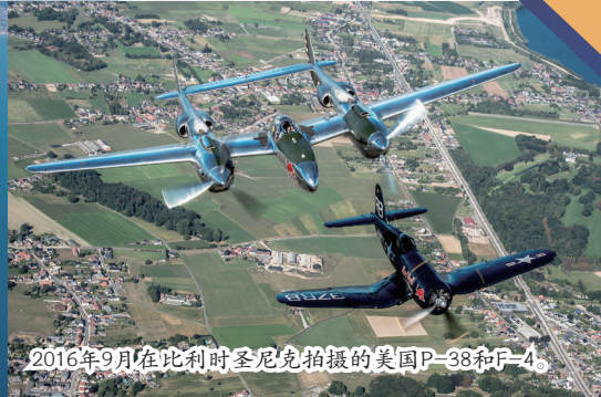
2016年9月在比利时圣尼克拍摄的美P-38和F-4。