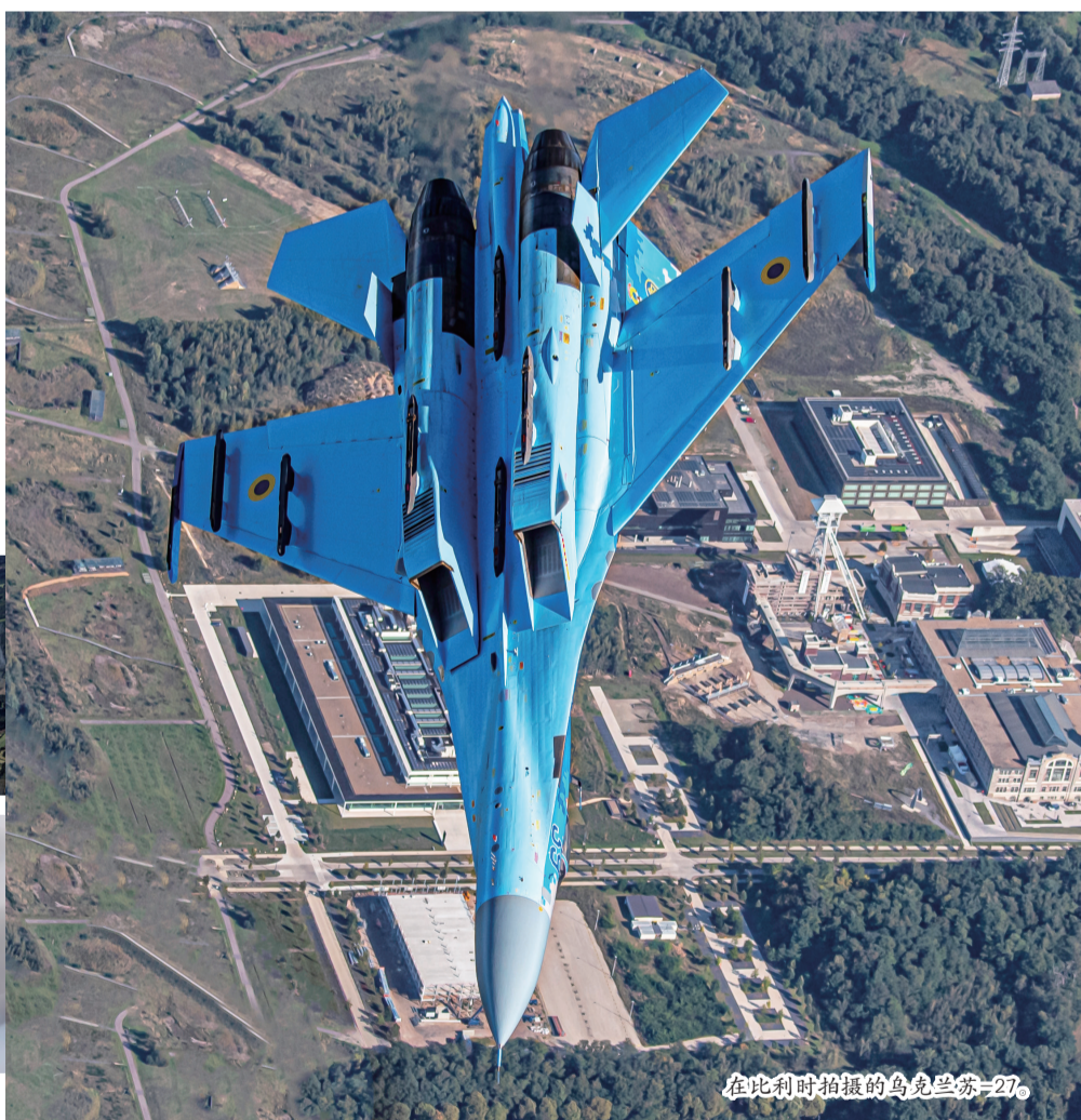
在比利时拍摄的乌克兰苏-27。