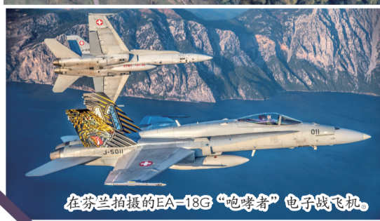
在芬兰拍摄的EA-18G“咆哮者”电子战飞机。