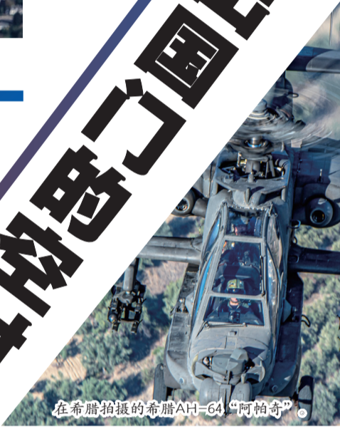
在希腊拍摄的希腊AH-64“阿帕奇”。