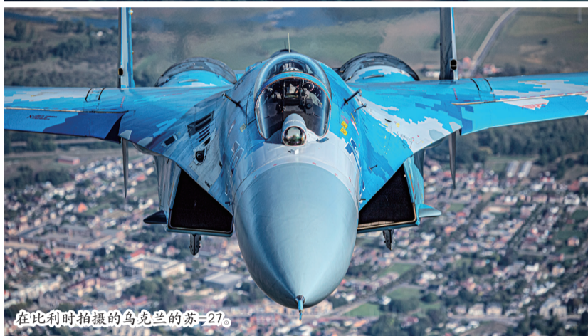
在比利时拍摄的乌克兰的苏-27。