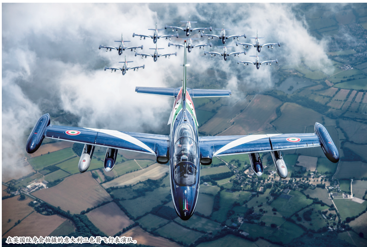
在美国纹身会拍摄的意大利三色箭飞行表演队。