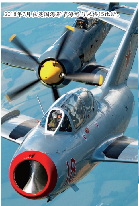
2018年7月在英国海军节海怒与米格15比斯。

出于对军事的爱好，我的航空摄影是以军用飞机为主。有朋友问：“你拍来拍去都是那些飞机，又没有什么新的型号，你怎么就拍不腻？”我觉得每个型号的飞机都有自己不同的特征，摄影就是要在各种不同的光线、角度、环境中去发现飞机更美的角度。这个世界每天都有不同的精彩，在不同的时间、地点拍摄的飞机怎么可能都一样呢？摄影的乐趣就是要寻找不同的美。我的航空摄影就是要不断地去拍不同飞机不同角度的美。