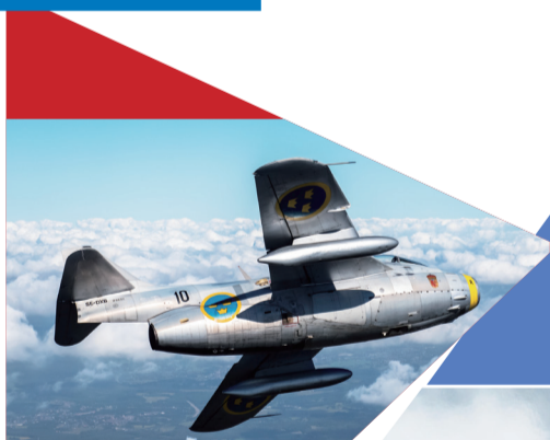
2016年9月在比利时圣尼克拍摄的瑞典萨博-29。

2016年迎来了期待已久升空拍摄的机会。而且是拍摄战斗机题材，着实兴奋不已、夜不能寐。第一次拍摄空对空题材，除了兴奋确实有些紧张，从未接触过的拍摄题材、拍摄条件，使心情更加紧张。空对空摄影搭乘的是运输机，洞开的后舱几乎是与外界贯通的，置于高空之中，除了冰冷单薄的机身支架，就是气流倒灌的寒风、发动机和风噪的巨大噪音，瞬息万变的气象使飞机随着气流剧烈颠簸，恐高的心理，极目之外尽是变幻莫测翻滚的云流，这一切对拍摄高质量的照片产生了较大的干扰。大地湖河山峦森林在云隙间闪现，但当被拍摄飞机由远及近地显现时，这一切已无暇顾及，统统淹没在了连连快门声中。随着拍摄架次的增多，很快融入了这一切，也更加喜爱航空摄影。