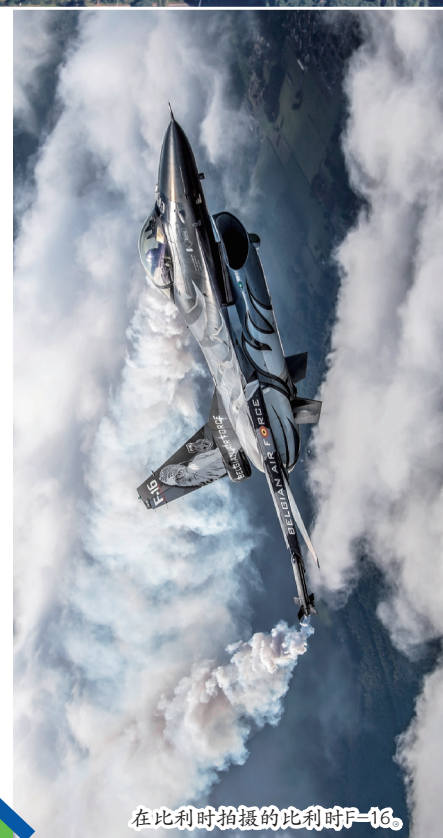
在比利时拍摄的比利时F-16。