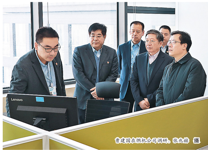
曹建国在燃机公司调研。

导一同听取了产品研发、示范项目、供应链管理、党的建设等工作汇报，并通过视频连线慰问了QD185示范项目团队。曹建国强调，燃机公司要加强自主研发，加大示范应用，加快产品成熟，要在沈阳市政府和集团在沈兄弟单位的有力支持下，发挥协同效应，推进燃气轮机产业做强做大。