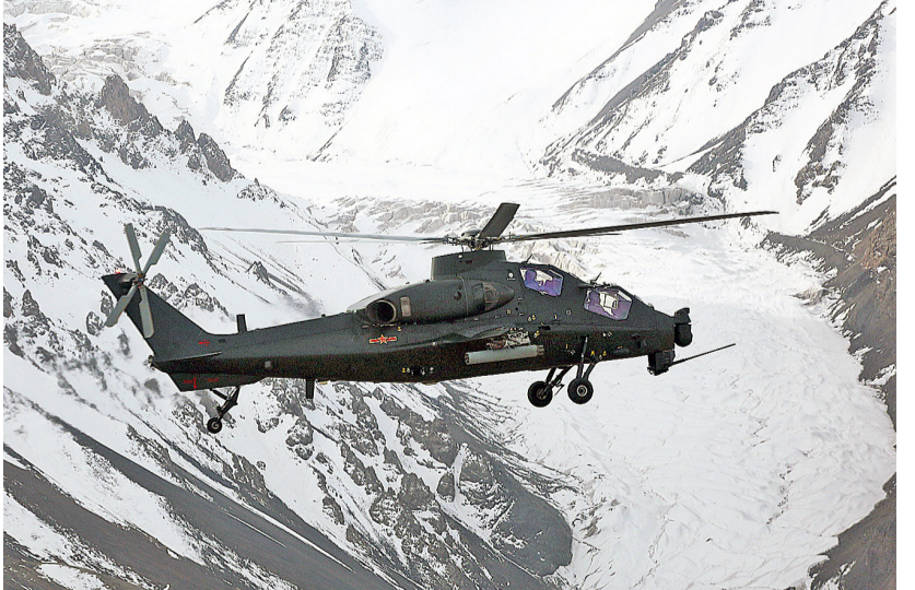
初冬时节,第77集团军某陆航旅在青藏高原某空域组织各型直升机越雪山、穿峡谷、过险隘,实施高原超低空隐蔽突防演练,不断锤炼部队作战能力。图为直10武装直升机飞越昆仑山脉。