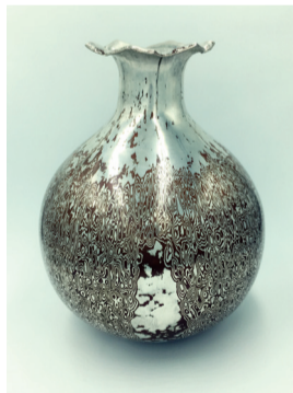
《石榴水滴》 木纹金瓶 直径18cm