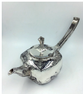
《雀》山水木纹金天 地方圆壶 直径13cm