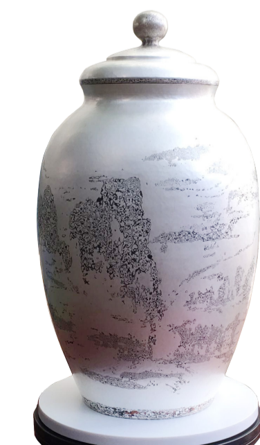
《天净沙秋》山水木纹金银罐 直径38cm