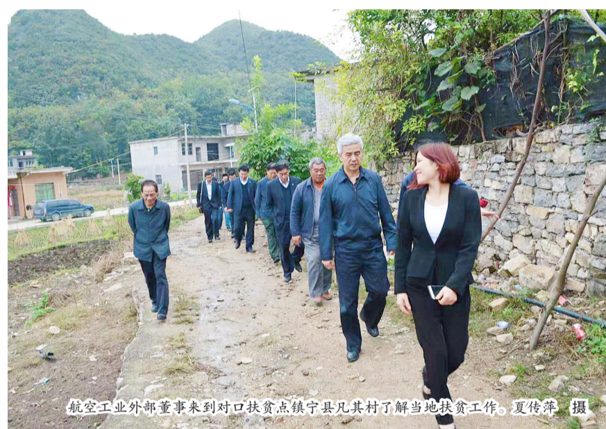
航空工业外部董事来到对口扶贫点镇宁县其村了解当地扶贫工作。

在黔的航空工业贵飞、永红、安吉3家单位，重点对各单位科研生产、经营运行质量和“十三五”规划落实、瘦身健体、军民融合等方面工作进行现场了解，并听取了各单位生产经营情况汇报。