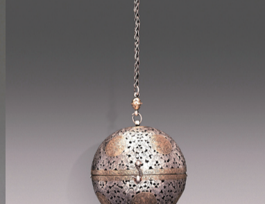
鎏金双蜂团花纹镂空香囊