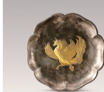
鎏金飞雁纹六曲银盘