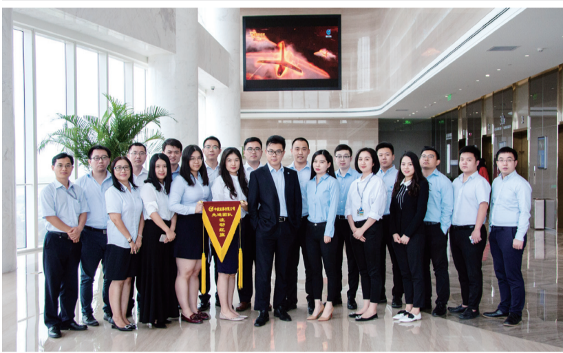
中航证券资管业务部团队