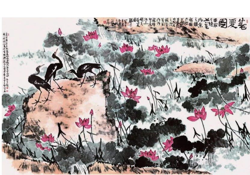
巨幅《盛夏图》 368厘米×580厘米

对于写意画家他还认为不写书法、胸无点墨都是不行的，他说：“不懂书法艺术，不练书法，就不懂什么叫大写意和写意美学了。”“单打一地画画不过是小道而已！须知比画高者有书法，书法之上有诗文，再上一层乃蕴含哲理之音乐，最高层次——大道乃是先贤之哲理：老庄、禅学、易学与儒学。”李苦禅先生真正道出了中国画高明之处，它是文人画，讲究的就是人文素养和人格修为。