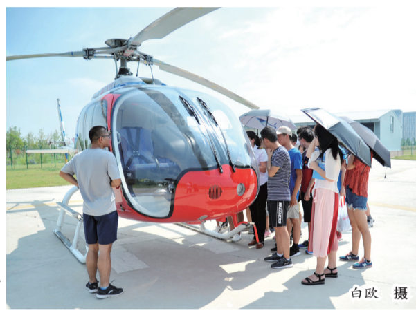
▶昌飞举行“第二届全国通航日”活动。