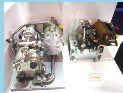
集成式微通道换热器和液冷单元。