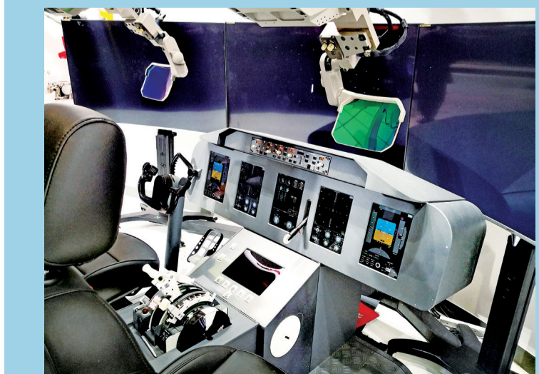
增强飞行视景系统(EFVS)亮相航展。

两年一度的英国范堡罗国际航空航天展览会于7月16日开幕。中国航空工业对接国际航空产业,以更自信从容的姿态又一次登上国际舞台。在这届航展上,中航科工作为中国航空工业航空高科技军民通用产品及服务上市平台,携民用航空整机、机载系统与零部件、航空工程服务等产品,全面展示其在国际市场开拓方面取得的新成就。除了产品展示,航空工业还举办了多项重大活动,以更加开放的态度和包容的胸怀大力拓展航空工业的国际合作领域。