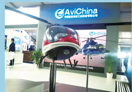
AC311直升机和AC312直升机模型。