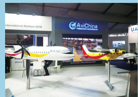
展台上的“新舟”700和运12飞机模型。