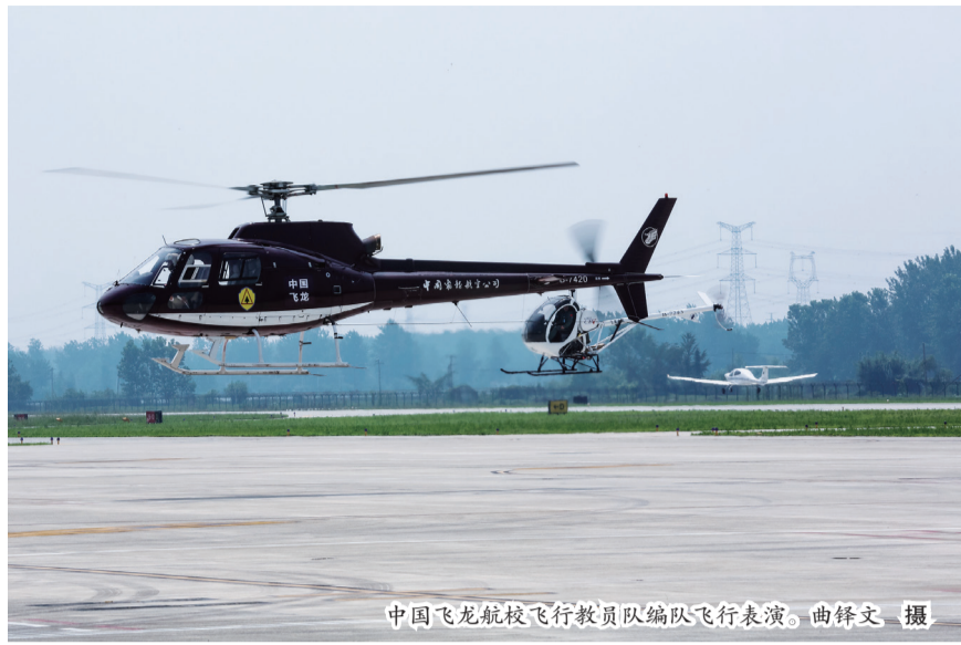
中国飞龙航校飞行教员队编队飞行表演。

陈光在讲话中介绍道，中国飞龙作为航空工业直升机的成员单位，成立至今已有近40年的历史，是中国民航总局批准成立的第一家地方通航企业。中国飞龙入驻建湖通航机场，是