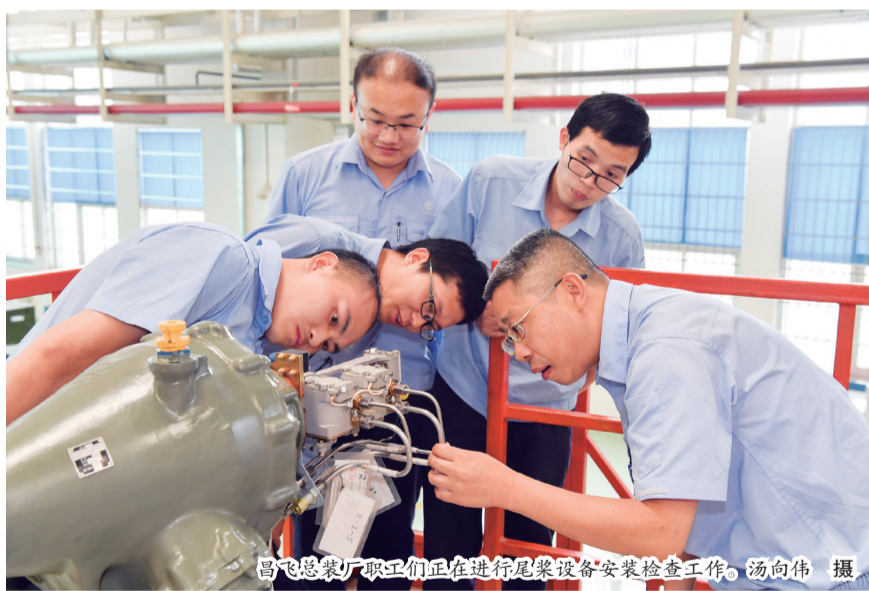
昌飞总装厂职工们正在进行尾梁设备安装检查工作。

下半年，昌飞面临的科研生产任务依旧繁重，形势依然严峻。7月2日，公司组建了7支创先争优党员攻坚突击队。针对重点任务，干部职工勇于担当作为，以科研生产任务为主线，以品