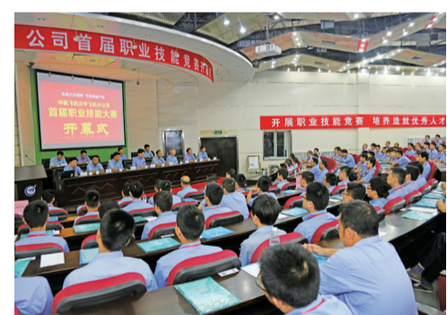
陕飞首届职业技能竞赛开幕式。

培训成果显著，党建成绩斐然。两年来，陕飞26个基层党组织被评为“先进基层党组织”、16位党组织书记被授予“优秀思想政治工作者”称号；4名基层党组织书记被陕西省国防科工办党委和航空工业飞机系统分党组授予“优秀党务工作者”称号；6个基层党组织被陕西省国防科工办党委和航空工业飞机系统分党组授予“先进基层党组织”荣誉。公司也先后荣获航空工业“四好领导班子”、首批“四星党组织”、“文化建设示范单位”称号；荣获国资委“中央企业先进基层党组织”称号。