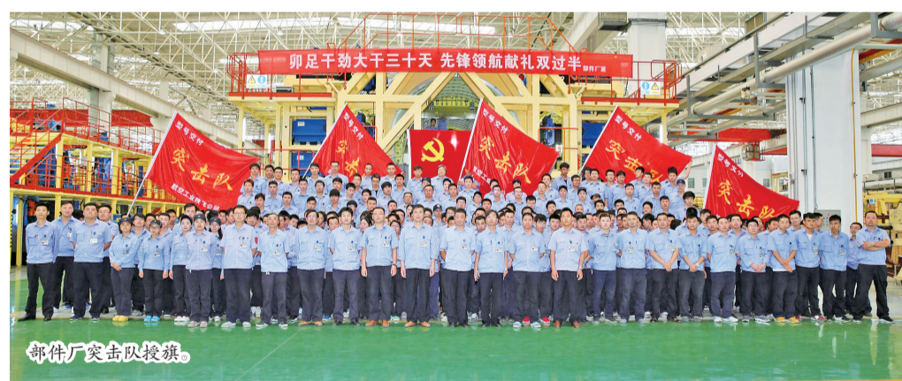
部件厂突击队授旗。