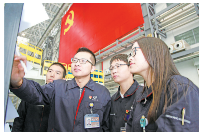
党员突击队现场解决生产问题。

新征程扬帆起航，新使命重任在肩。在砥砺前行道路上，西飞党委将继续坚定不移地全面落实航空工业党组要求，聚焦提质增效，聚力价值创造，进一步强化“航空报国”使命担当，围绕价值链、部署创新链、架构信息链、嵌入责任链，勇于改革创新，不断推进政治保证能力建设，提升党建工作科学化、规范化水平，不断增强党组织的政治领导力、思想引领力、群众组织力和社会号召力，团结带领全体职工创新求变，拼搏奋进，以一以贯之打造“智慧西飞”，致力于让西飞最终成为绩效卓越、世界一流的新时代创新型航空工业企业，为建设新时代航空强国贡献力量！