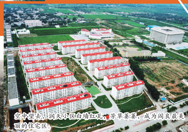
空中望去，洞天小区白墙红瓦，芳草萋萋，成为阎良最美丽的住宅区。