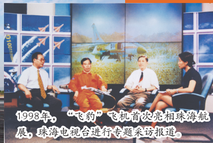
1998年，“飞豹”飞机首次亮相珠海航展，珠海电视台进行专题采访报道。