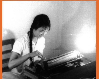
20世纪70年代，这种打字机当时承担了全所的文件打印任务。