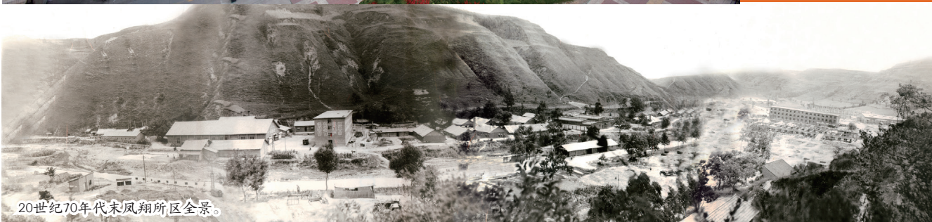
20世纪70年代末凤翔所区全景。