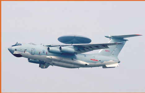
我国第一架大型预警指挥机——空警2000。