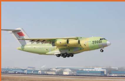
我国第一架大型运输机——运20飞机。