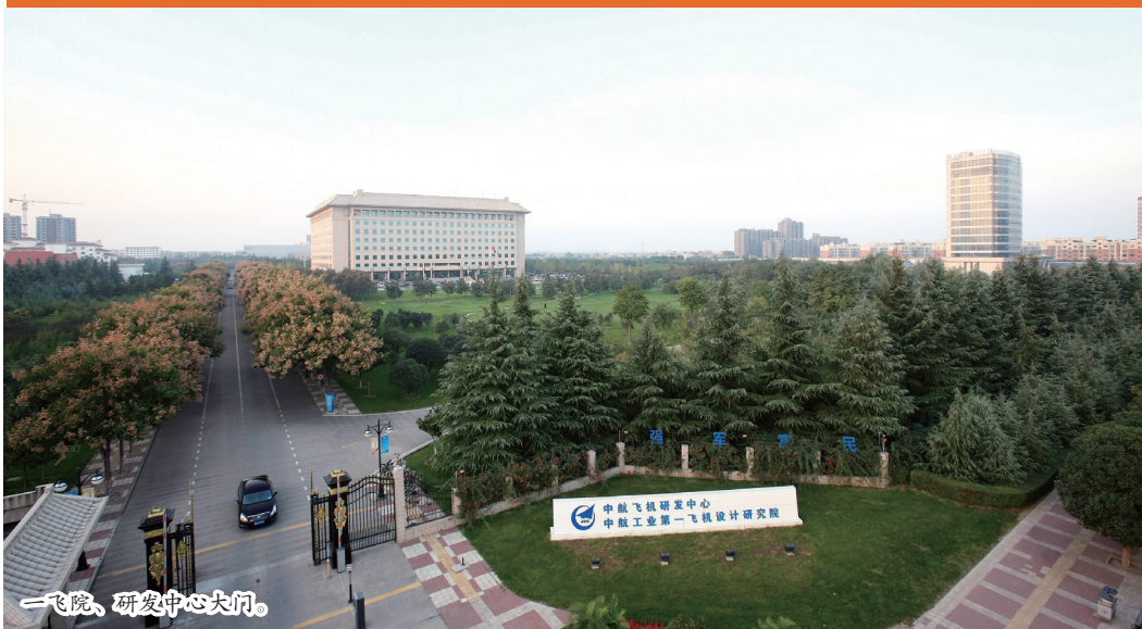
一飞院、研发中心大门。