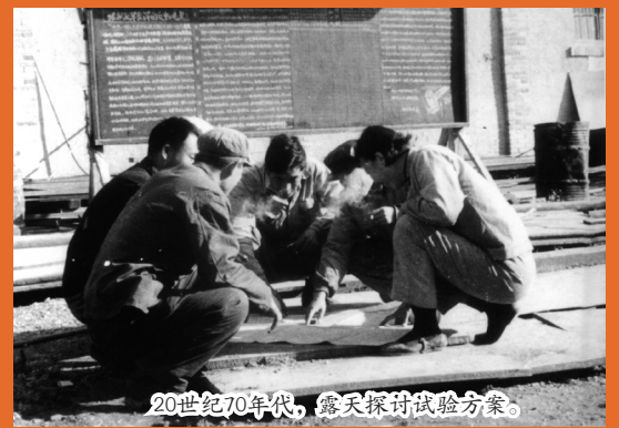
20世纪70年代，露天探讨试验方案。