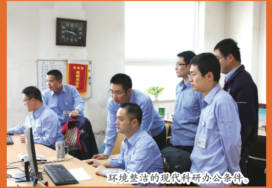
环境整洁的现代科研办公条件。