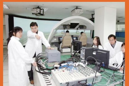
综合航电验证试验。