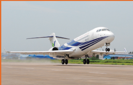
我国新一代支线客机——ARJ21飞机。