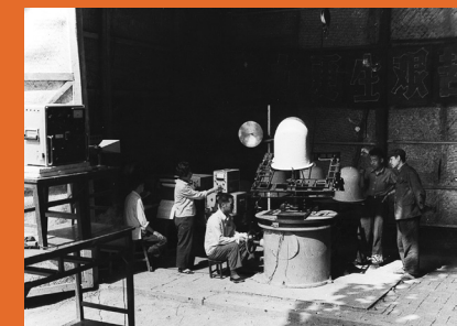
20世纪70年代，因陋就简，席棚里面做试验。