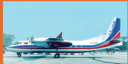
我国第一架支线客机——运7飞机。