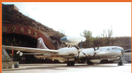
我国第一架空中预警机——空警1号。