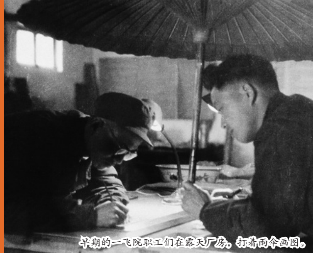
早期的一飞院职工们在露天厂房，打着雨伞画图。