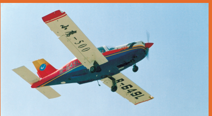
我国第一架轻型公务机——“小鹰”500飞机。