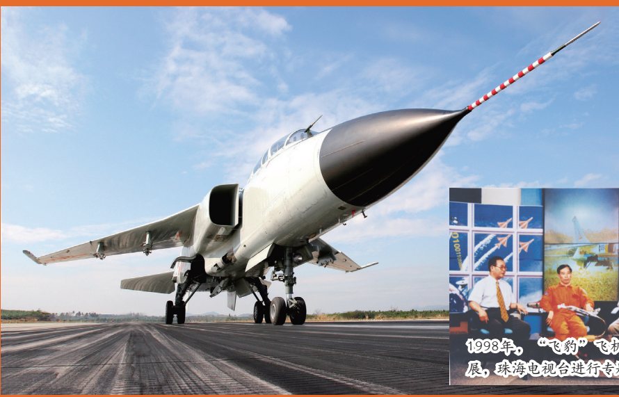
我国第一代双座、双发超音速歼击轰炸机——“飞豹”歼击轰炸机。