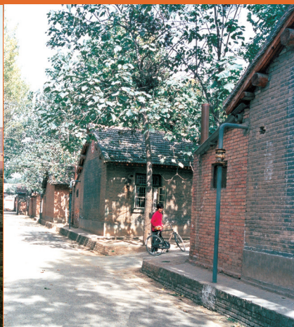
20世纪80年代的原家属区北平房。