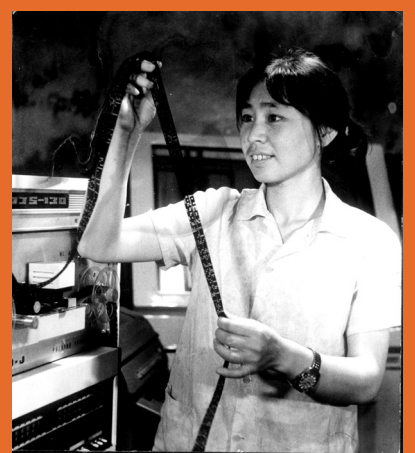
1978年，在DJS-130计算机上工作的情景（检查纸带）。