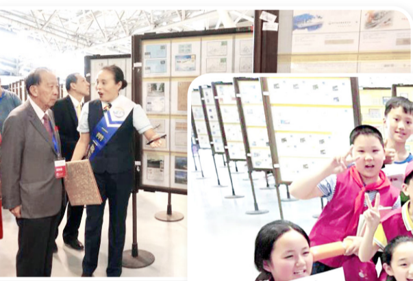
国际集邮联主席郑炳贤正在参观。

随着中国制造业技术的快速进步，伴随国家一带一路战略的实施，未来将有更多中国国产飞机出口到世界各地，中国民航航线的发展必将更加方便不同国家间的人员交往，为人类命运共同体建设提供中国方案。相信中国航空邮品的影响力也会与日俱增，受到社会各界越来越广泛的关注。