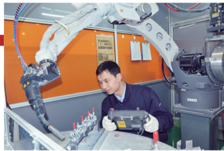
新航豫新 调试焊接机器人。