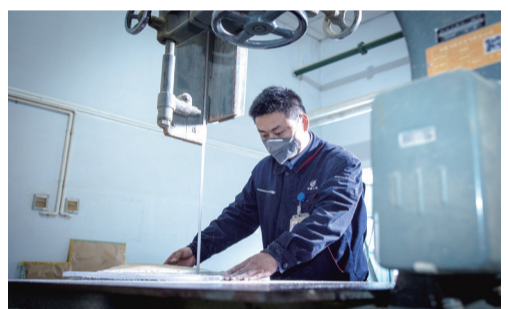
陕飞非金属厂 成型玻璃产品切割。

青年是国家的希望,也是中国航空工业的希望,在实现“航空梦”、助力“中国梦”的伟大征程中,航空青年重任在肩,使命光荣。航空青年正在以饱满的精神状态和昂扬的奋斗姿态,为建设航空强国而顽强拼搏。 奋斗的青春最美丽