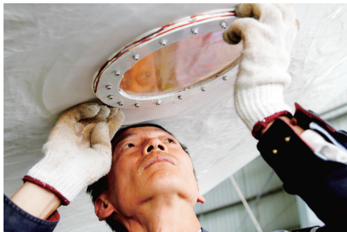
特飞所 浮空器项目总装现场。