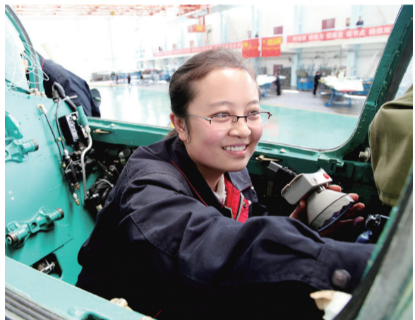
天飞 飞机修理工作复杂而辛苦,职工们脸上洋溢的笑容是他们工作热情的最好诠释。