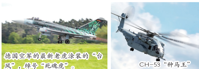
德国空军的最新老虎涂装的“台风”,绰号“死魂虎”。