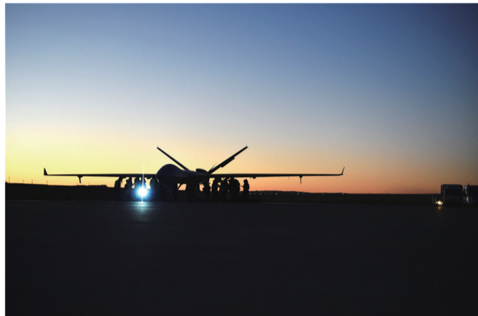
成都所 “翼龙” II 无人机机场机务准备。

青年是国家的希望,也是中国航空工业的希望,在实现“航空梦”、助力“中国梦”的伟大征程中,航空青年重任在肩,使命光荣。航空青年正在以饱满的精神状态和昂扬的奋斗姿态,为建设航空强国而顽强拼搏。 奋斗的青春最美丽