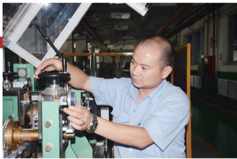
新航 车间里的设备“医生”。