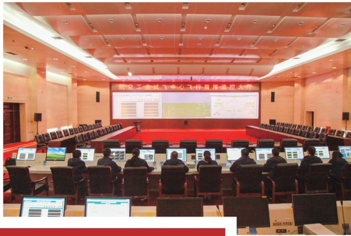
试飞中心 航空试飞人严阵以待进行飞行试验任务监控。