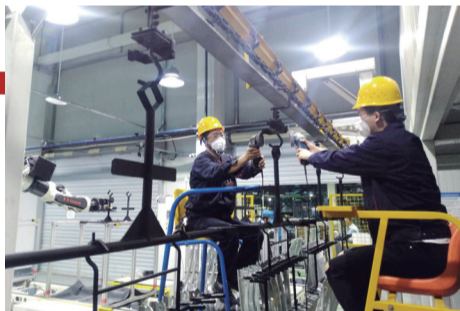
贵阳万江 空中作业。