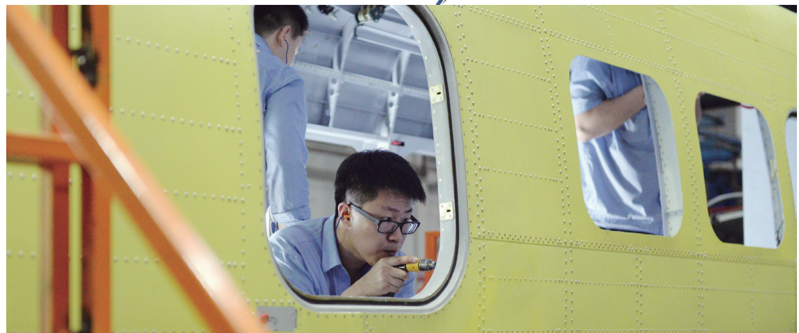
哈飞 铆装车间全神贯注的铆装工。