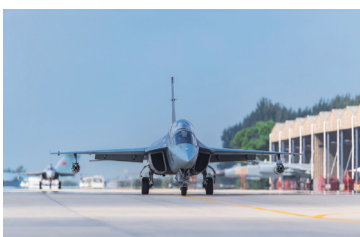
2017年8月, 空军教10参加航空飞镖大赛

L15 高级教练机十年磨一剑, 从研制到批产经历了漫长岁月。在研制过程中, 洪都公司积极开拓国外市场, 通过参加航展、飞镖大赛等活动展现飞机性能, 提升知名度。2015年12月, 高教机交付首个海外客户。2016年的第8届南非防务展中, L15 高级教练机被誉为来自东方的“空中明星”。