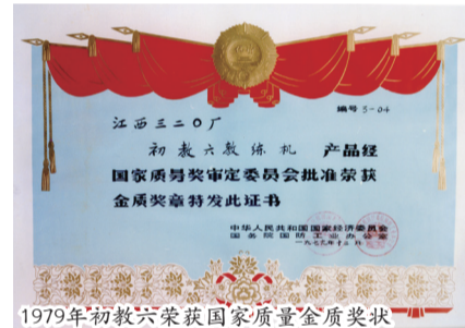
1979年初教6荣获国家质量金奖