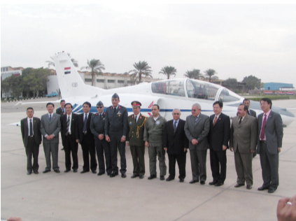
2005年12月11日第80架K8E交付埃及空军。