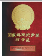
国家科技进步奖特等奖

强5飞机的出口, 对于刚进入改革开放的中国来说, 是开创性的举动。通过参加航展、巡回表演、用户评估试用等多种方式, 寻求新的发展模式, 开展了一系列全方位的市场促销活动, 不仅为后续K8等机种大力开拓国际市场奠定了基础, 也为洪都公司在管理上得到与国际航空外贸市场接轨的实战演练机会, 积累了在项目管理和组织上的有益经验, 迎来了洪都开创外贸出口的新时代。