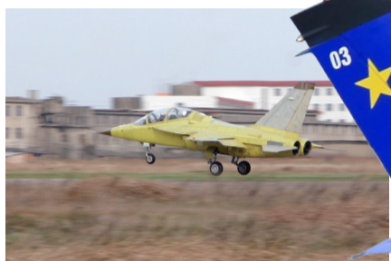
2006年3月13日, L15高教机01架首飞

K8 教练机对内列装部队, 对外出口交付占世界同类教练机出口贸易总量的70%, 并开创了成套航空产品技术出口建线的先河, 形成了国内、国际两个市场相互依托、相互促进、共同发展的局面; L15 高级教练机达到了与国外的先进机型相当的技术标准, 是中国航空工业努力赶超世界先进技术的一个重要成果; 南昌航空工业城由蓝图逐渐变成现实, 现代化的厂房与新设备, 新生产线加紧建设, 这里承载着洪都人再创新辉煌的美好愿望。展望未来, 洪都公司将不忘初心, 牢记使命, 努力用“洪都梦”编织“中国梦”“航空梦”“强军梦”, 为全面建成新时代航空强国的目标而努力奋斗!