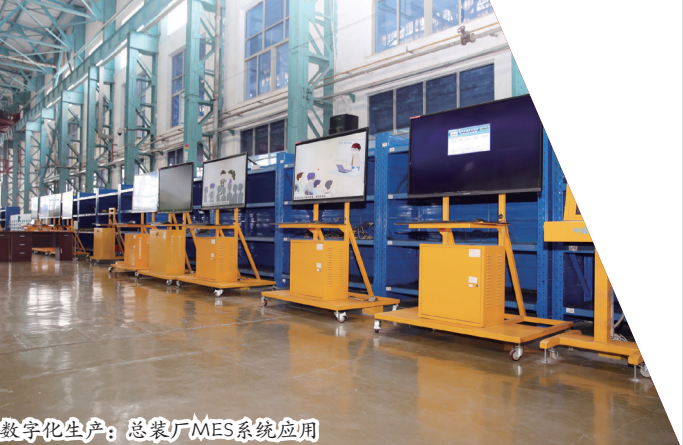
数字化生产: 总装厂MES系统应用