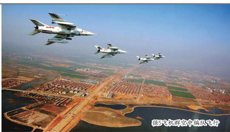
强5飞机群空中编队飞行