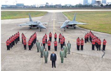
2015年12月, 高教机交付首个海外客户