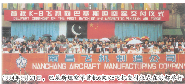
1994年9月21日, 巴基斯坦空军首批6架K8飞机交付仪式在洪都举行

从1966年开始, 初教6以军援的方式走出国门, 并在改革开放后进行了出口贸易。从20世纪60年代至今, 包括军援, 洪都公司共对外出口飞机225架。