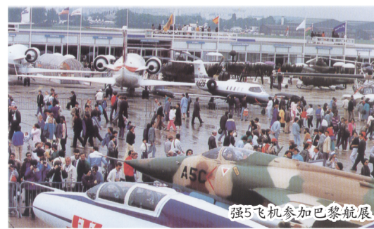
强5飞机参加巴黎航展