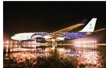
HiFly航空的包机准备出港。