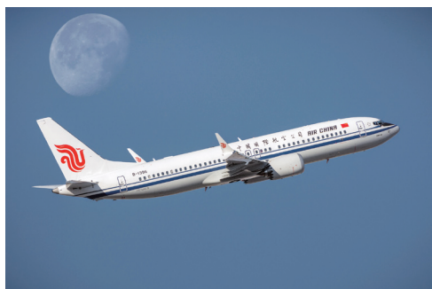
中国民航进入MAX时代。