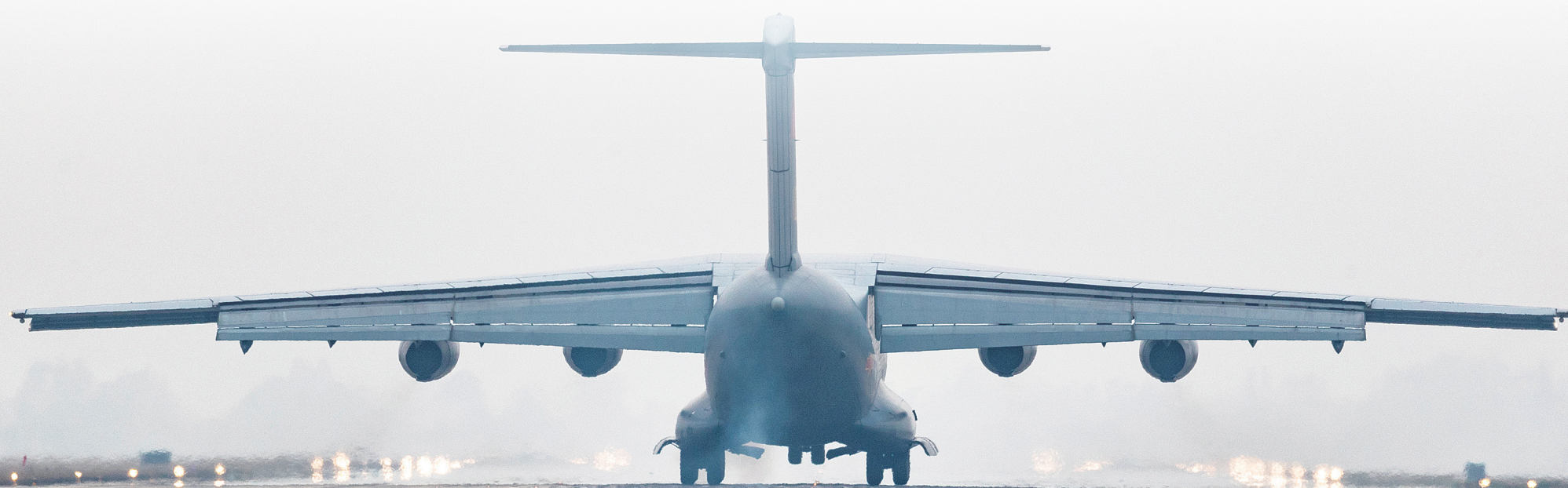
远途归来的“鲲鹏”。