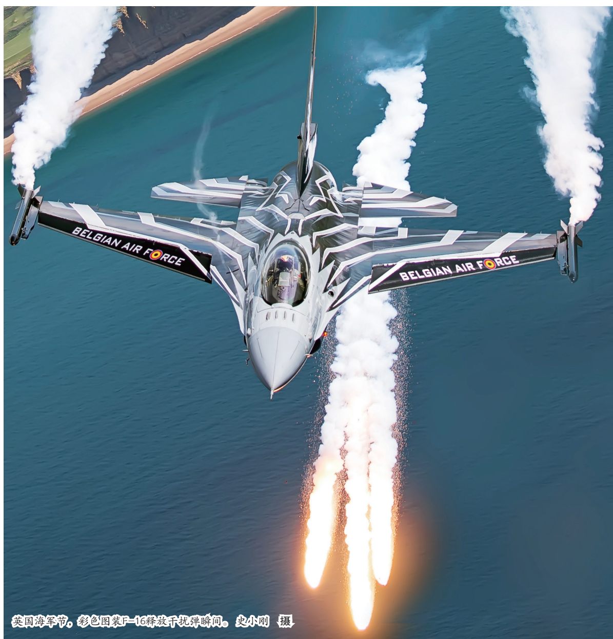
英国海军节,彩色涂装F-16释放干扰弹瞬间。