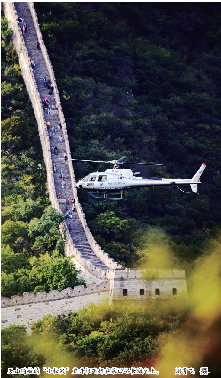
天山通航的“小松鼠”直升机飞行在慕田峪长城之上。

征集稿发布后,收到来自广大网友的踊跃投稿。日前,经过网络投票,评选出“2017年度最受网友喜爱”奖五名和“编辑推荐”奖五名。现将获奖作品刊发,以飨读者。