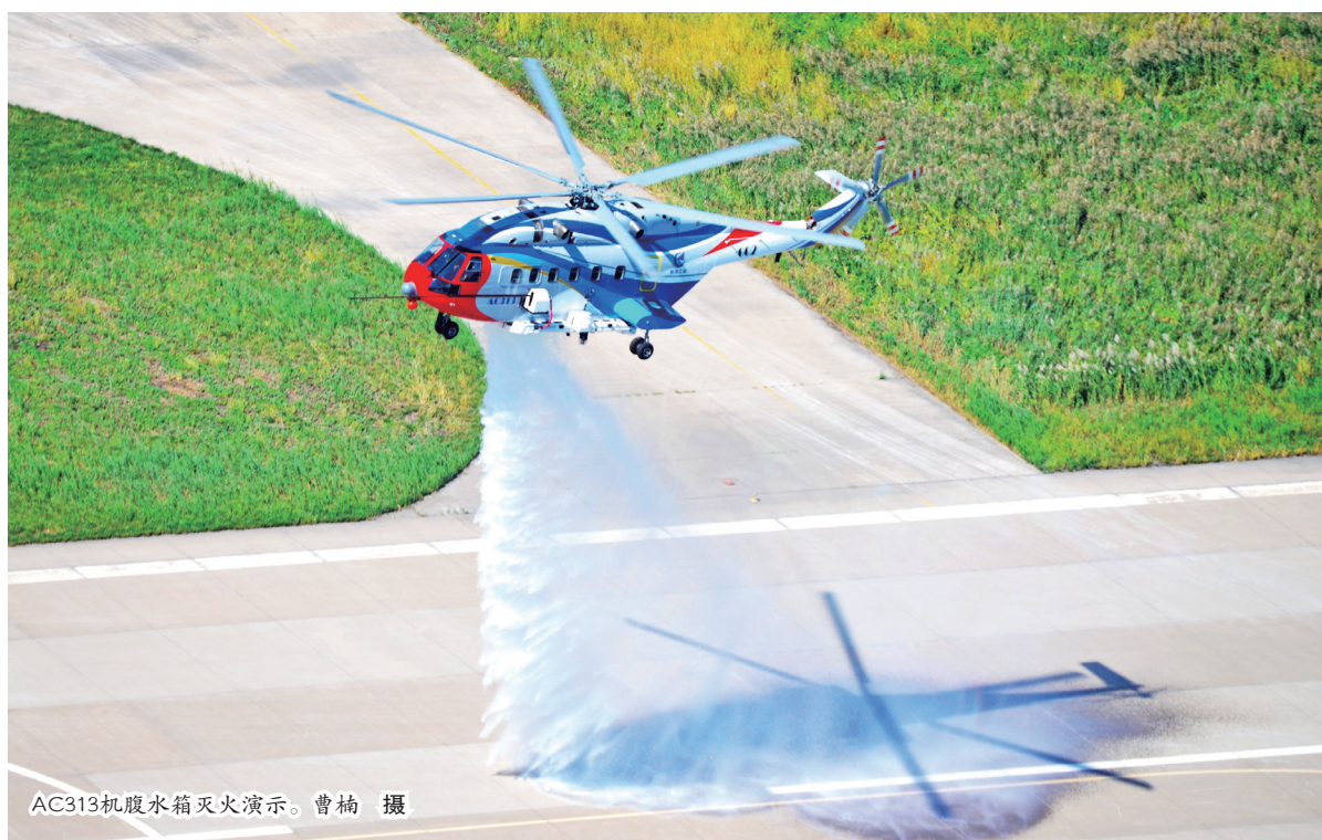
AC313机腹水箱灭火演示。