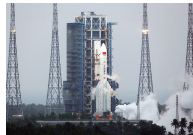
长征五号遥二火箭准备发射。