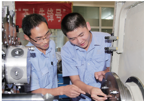
航空工业南京机电的技术能手正在工作中。