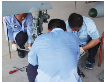
航空工业试飞中心试飞人在高温下坚守在型号试飞一线。