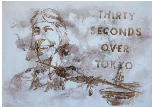
被中国军民营救的美国飞行员