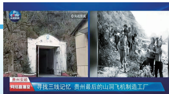
寻找三线记忆 贵州最后的山洞飞机制造工厂

曾经的工业设备今天依旧还在这里，成为了国家工业制造的一份记忆，见证着从山洞里摸索，到今天将自己制造的飞机远销海外中国航空人的旅程。