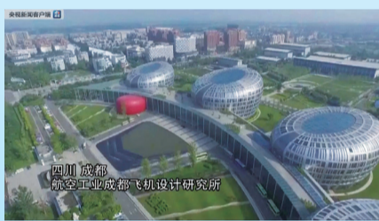
航空工业成都飞机设计研究所。