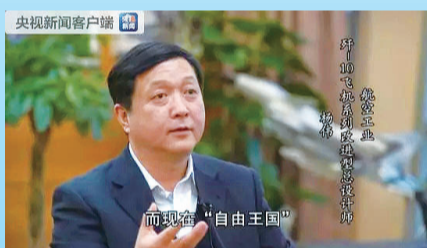
歼10飞机系列改进型总设计师杨伟。