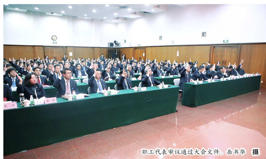
职工代表审议通过大会文件。

大会报告全面总结了航空工业第一届职代会的工作,指出近年来航空工业加强以职代会为基本形式的职工民主管理建设,构建了现代企业民主管理运行体系,拓宽了职工代表作用发挥渠道,提升了职工代表履职能力,增强了群众组织的凝聚力和战斗力,职工民主管理制度不断完善,广大职工