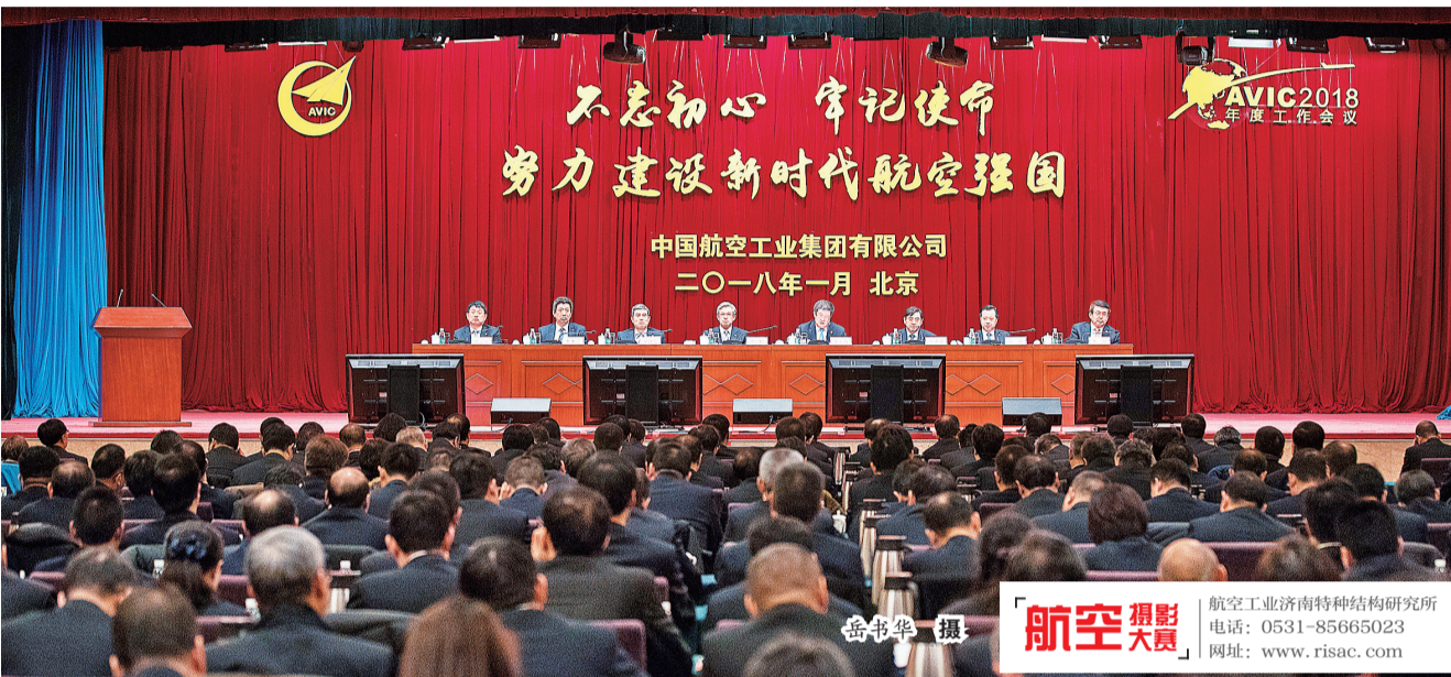
航空工业济南特种结构研究所 电话:0531-85665023 网站:www.risac.com