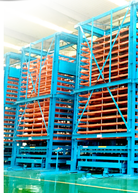
中航物流为航空工业贵飞设计研发立体智能板材料库。