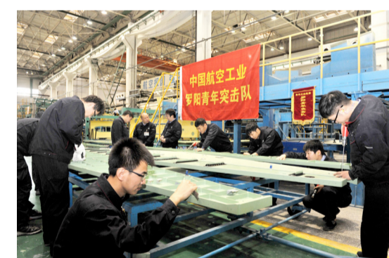
航空工业沈飞部装厂罗阳突击队的队员正在全力完成年底攻坚任务。

开展“三定”工作，实现“瘦身健体”。紧锣密鼓推进国企改革、“瘦身健体”工作，旨在解决国有企业管理层级多、冗员多、效率低等突出问题，实现企业在发展中“轻装上阵”。近年来，沈飞公司进入了快速发展新阶段，但由于历史沉积的原因，企业内部组织机构臃肿庞杂，工作效率低下，严重影响了企业战略落地和健康发展，迫切需要“瘦身健体”、内生发展动力。2017年，按照航空工业提出的“聚焦主业发展、优化组织机构、压缩管理层级、瘦身健体、流程体系建设、企业内控等要求，以建立起扁平化的组织机构和精干高效的干部队伍，提高企业运行效率为目标，持续优化组织机构，逐步构建规范、高效的组织结构体系。经过近半年时间的努力，公司的职能部门从原有的四级简化为两级；责任单位数量由原来的81个调整为52个。有计划、有步骤推进“三定”工作，逐步减少各级领导干部和管理人员，切实提高了公司整体运行效率。