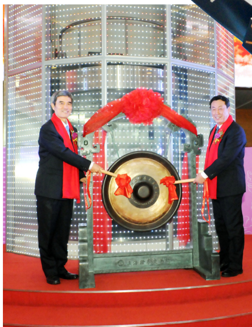
中航沈飞公司上市。

过资本市场运作，不断提升国有资本配置和运营效率及企业核心竞争力，不断提高市场化资源配置效率及公司治理和市场化经营管理水平。一方面公司治理将引入社会公众股东的监督，另一方面通过探索多种方式，实现企业核心管理和技术人员与企业“贴身经营”，吸引和留住优秀技术人才，不断增强企业发展的动力和活力。