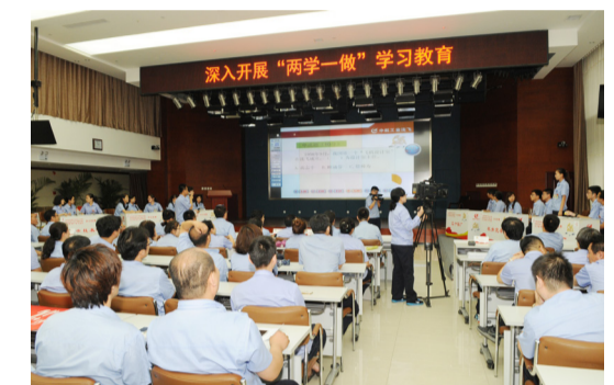
深入开展“两学一做”学习教育。

在企业的发展中，沈飞公司党委全面贯彻落实习近平总书记的系列讲话、党的十九大和党的十九届二中全会的精神，始终坚持党的领导不动摇，坚持党的建设与企业深度融合，按照党中央和航空工业等上级党组织统一部署，结合公司“十三五”党建工作要求，积极推动航空工业“1122”党建工作体系实施，持之以恒地推动全面从严治党向纵深发展，切实把提高企业效益、增强企业竞争力、实现国有资产保值增值作为出发点和落脚点，用改革发展最终成果检验企业的党建工作。紧密围绕企业科研生产中心任务，举旗引领、凝聚共识，充分发挥公司党委政治核心作用、基层党组织战斗堡垒作用、共产党员先锋模范作用、为完成科研生产任务、做强做优做大企业提供了坚强的政治保障和组织保障。