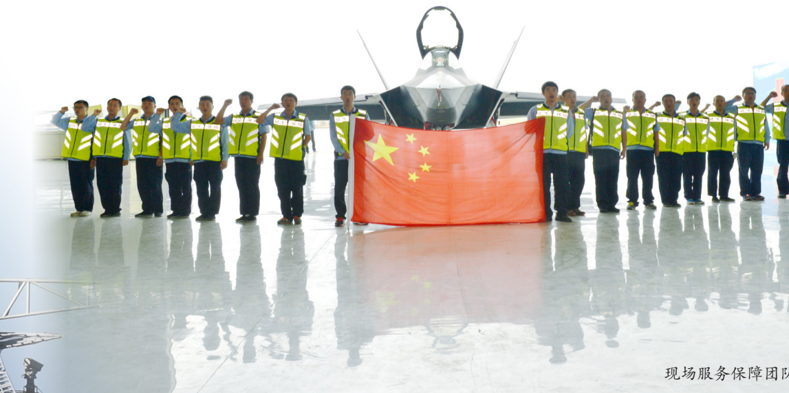
现场服务保障团队