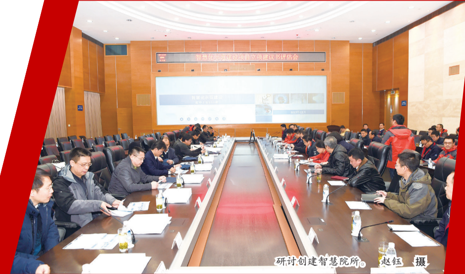
研讨创建智慧院所。