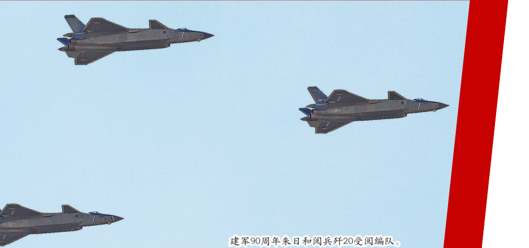
建军90周年朱日和阅兵歼20受阅编队。