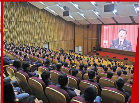
集体观看十九大开幕式。