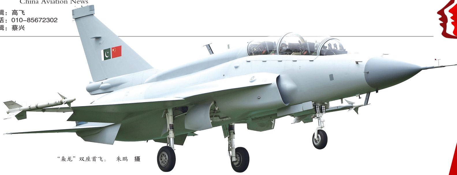
“枭龙”双座首飞。朱鹏 摄