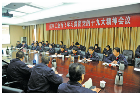
召开学习贯彻十九大精神会议。