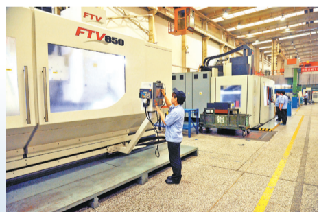
模具锻铸厂精益改进现场。