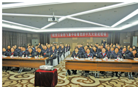
集中收看党的十九大开幕实况。

逆水行舟用力撑，一篙松劲退千寻。新的一年，机遇与挑战并存，光荣与梦想同在。西飞将以党的十九大精神为指引，保持政治定力，担当发展使命，加快推进“智慧西飞”建设，用勤奋定义我们的2018，在推动公司运营管理突破升级中展示新作为，取得新突破，实现新跨越！