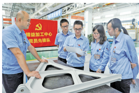
精益加工中心党员先锋队。