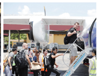
▲乘客登上“新舟”飞机。