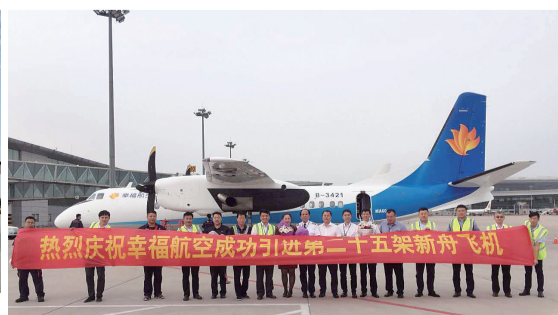
幸福航空引进第25架“新舟”飞机。