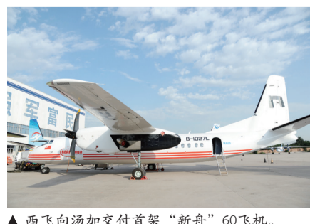
▲西飞向汤加交付首架“新舟”60飞机。