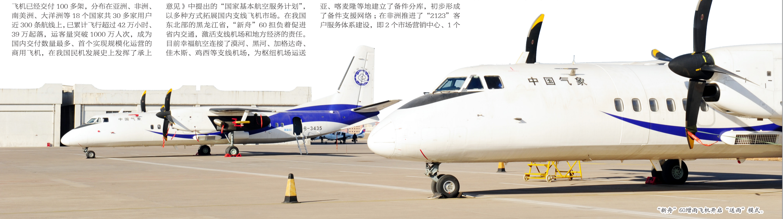
“新舟”60增雨飞机开启“送雨”模式。

展望未来，航空工业将在抓好“新舟”60/600飞机持续改进和发展体系建设，巩固和扩大市场开拓和客户服务成果的同时，下大力气深入推进“新舟”700飞机的研制，形成涡桨支线飞机发展的核心竞争力，跻身系列化、网络化、多谱系自主研发国际先进水平商用飞机的国家之列；使产品具备全球竞争力的性能、客户服务支援网络完善，挑战世界一流涡桨支线飞机，成为多用途商用飞机产品和服务的提供商。