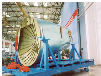
2007年6月29日中方与美波音公司正式签订B737-48段转包生产合同，此为转包件成品