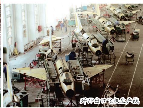
歼7P出口飞机生产线