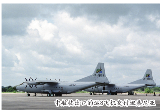
中航技出口的运8飞机交付坦桑尼亚