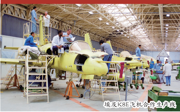
埃及K8E飞机合作生产线