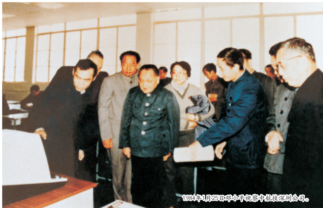
1984年1月25日邓小平视察中航技深圳公司。