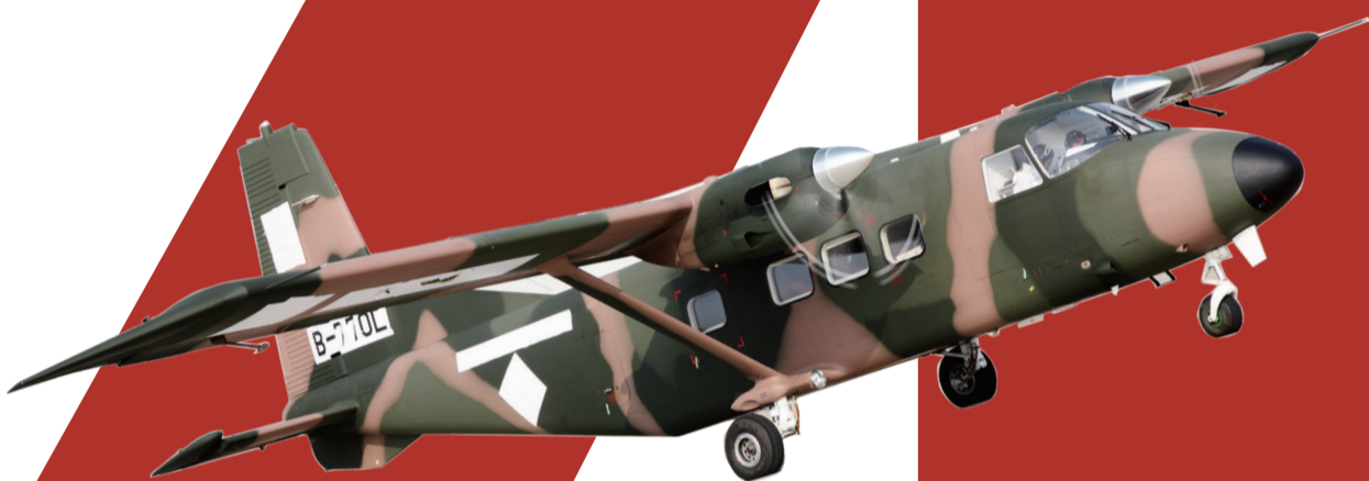
中航技出口的运12飞机交付坦桑尼亚