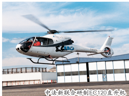
中法新联合研制EC120直升机