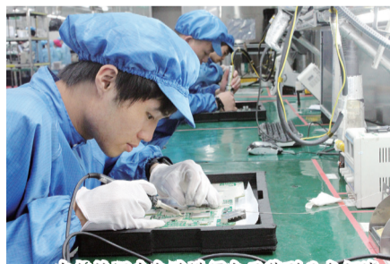
中航技深南电路进军电子装备业务领域