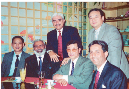
1991年由中巴合作的超7项目（“枭龙”飞机）在新加坡航展期间正式宣布立项

这是一片荒芜的土地，坐落在南海边，然而这又是一片神奇的土地，从某种意义上讲，当地中国的传奇就发生在这里！