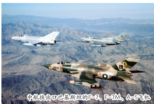
中航技出口巴基斯坦的F-7、F-7M、A-5飞机