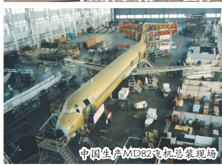
中国生产MD82飞机总装现场