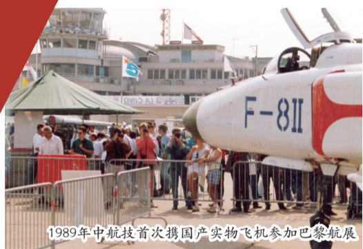
1989年中航技首次携国产实物飞机参加巴黎航展