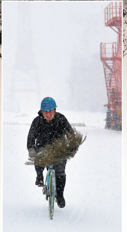
一名造船工人顶风冒雪，骑自行车赶往码头清雪。