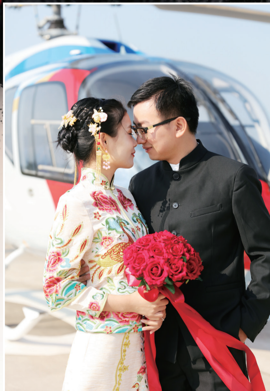
一对新人在直升机旁相依在一起，留下了这甜蜜幸福的瞬间。