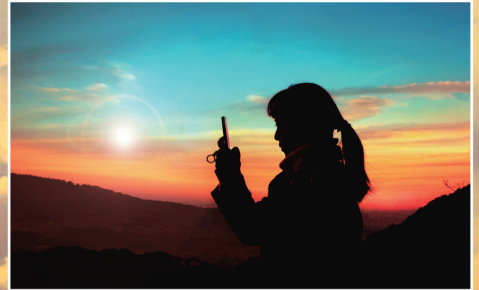
所谓的小美好，就是上帝把你带到我身边，用真心交换真心，我定不会辜负你！我们会一起走过人生道路上的荆棘，也会尝遍生活的酸甜。我知道这个世界什么都在变，但唯一不变的就是你，你永远是我生活的小美好！