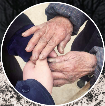
春节假期结束了，倔强的奶奶坚持要把孙子，孙媳送到车站，一路唠叨着已经说了很多遍的关心的话，一定吃好，穿暖，好好工作……看着奶奶粗糙的手，不知道我还能再握几次。