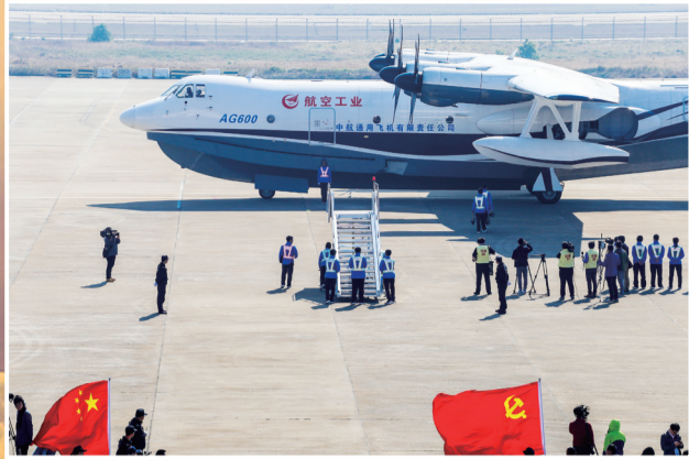
大型水陆两栖飞机AG600，承载着国家和民族的使命，是航空人打造的“国之重器”，是我国大飞机领域研制工作取得的又一重大成果，填补了我国在大型水陆两栖飞机领域的研制空白。