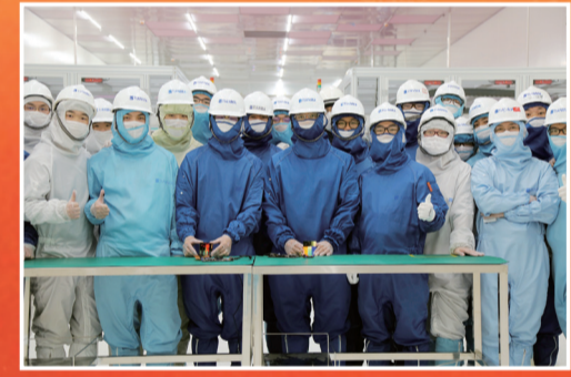
天马第6代LTPS AMOLED生产线，中国率先点亮。