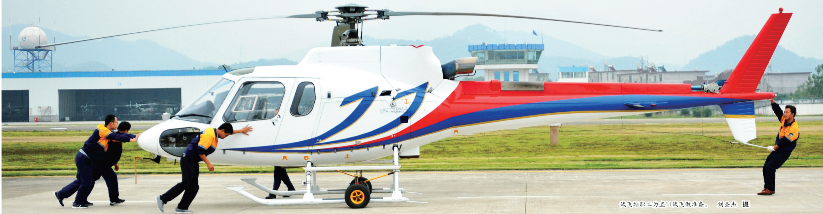
试飞站职工为直11试飞做准备。