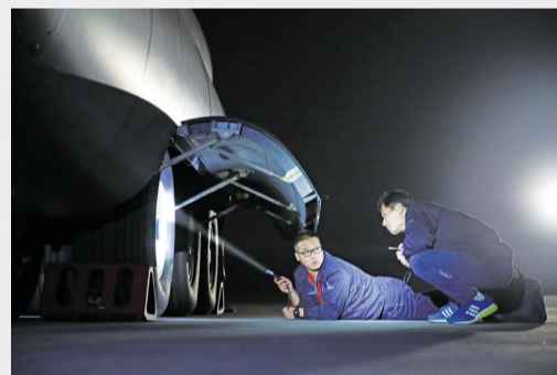
晚上，外场服务保障人员对完成飞行任务的飞机进行例行检查。