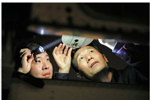
深夜，“鲲鹏”服务保障团队人员对飞机进行例行检查。