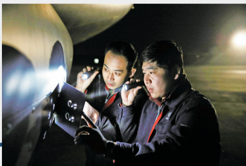
“鲲鹏”服务保障团队进行例行检查。