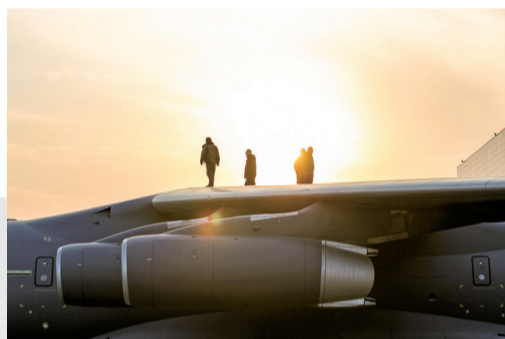
清晨，试飞站机务团队进行飞行前准备工作。