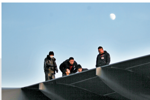
月光下的保障人员。