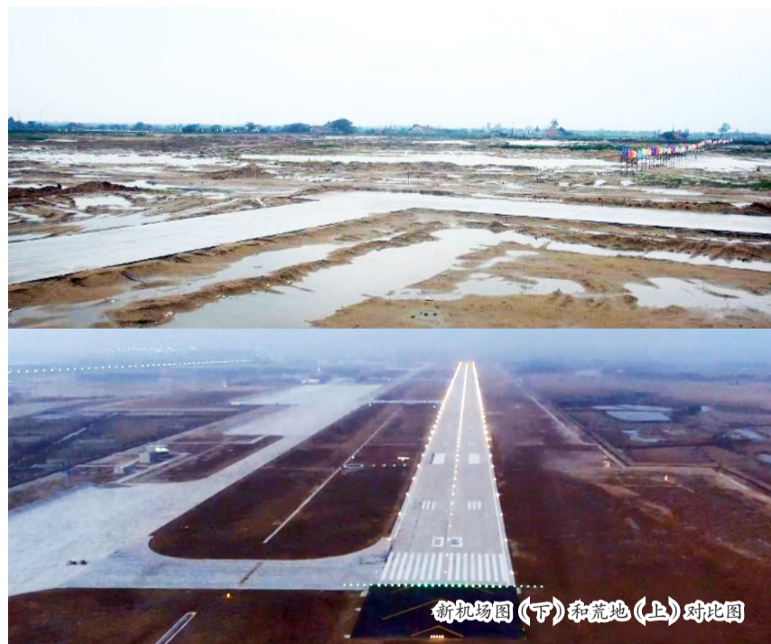
新机场图(下)和荒地(上)对比图

每个人的信仰、行为都影响着工程的质量、安全和进度。党小组就这样潜移默化地走进每个项目部成员的心中。重点试验室项目部的会议室墙上，一面党旗记录着重点试验室每一个阶段的艰难前行，也无形中给予大家信心和力量；瑶湖机场建设期间，从上空望下去，工地一片繁忙，500多辆土方车辆穿梭其中。为确保瑶湖机场建设进度，作为总承包商的飞机工程院项目部成员拼尽全力与各合作方一起，