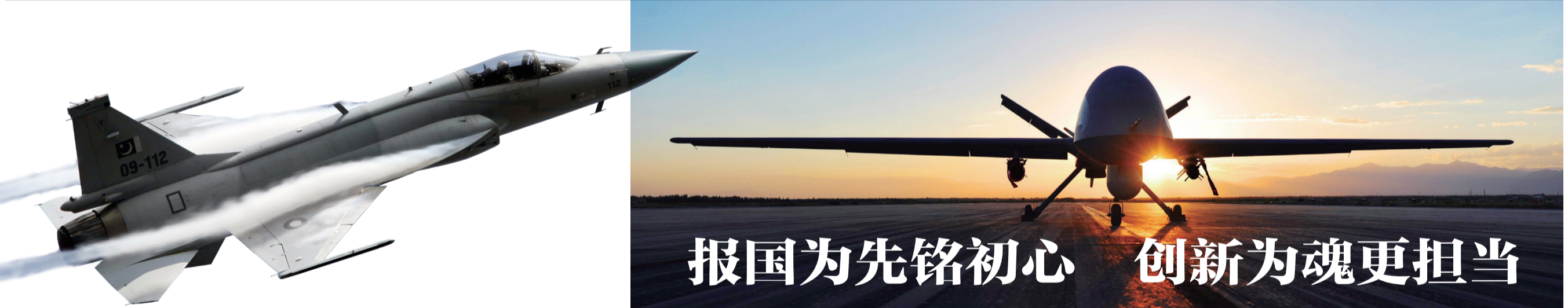
航空工业成都所所长 季晓光 航空工业成都所党委书记 李松

准体系中大量借鉴了荆门爱飞客航空小镇的建设经验。湖北省标准化与质量研究院副院长吴斌表示，要把荆门爱飞客小镇建设成全国示范，要强化标准化顶层设计和系统布局，充分发挥标准化对科技创新的引领作用，加强标准化与技术创新和产业发展的深度融合，创立国内一流的爱飞客标准化品牌，树立航空小镇标准化建设标杆，带动产业整体提升和区域经济发展。（余合）