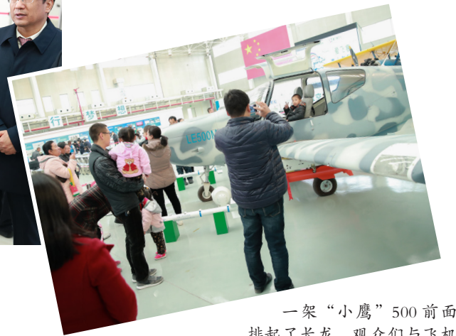
一架“小鹰”500前面排起了长龙,观众们与飞机零距离接触。