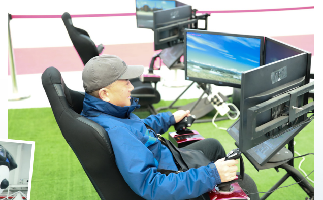
观众体验飞行模拟机