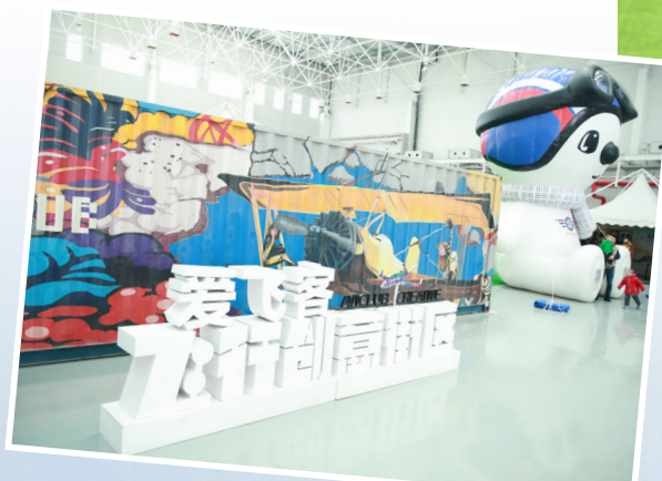
爱飞客飞行创意街区