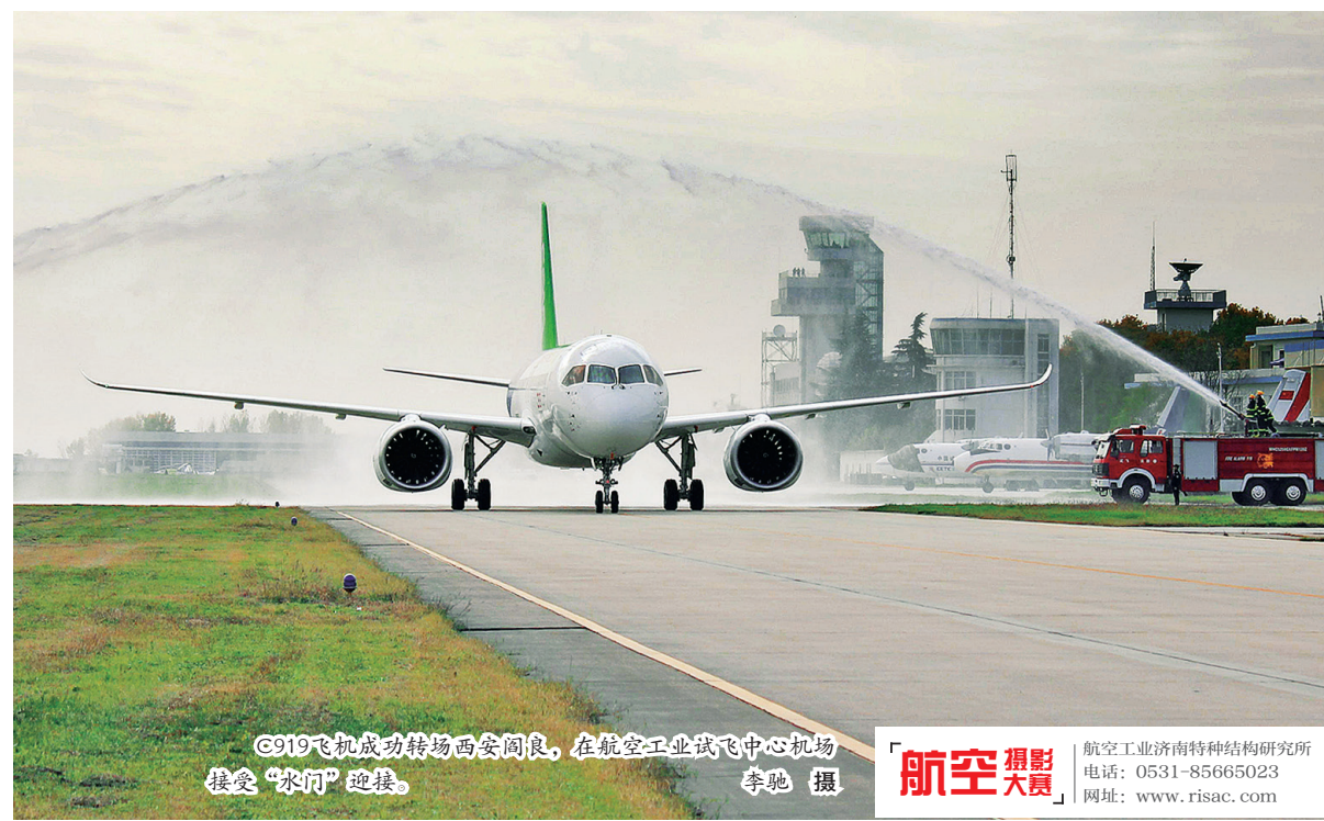
C919飞机成功转场西安阎良,在航空工业试飞中心机场接受“冰河”迎接。