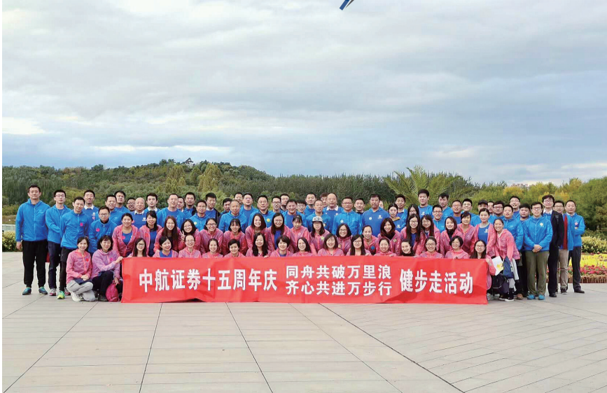
中航证券十五周年庆 同舟共破万里浪 齐心共进万步行 健步走活动