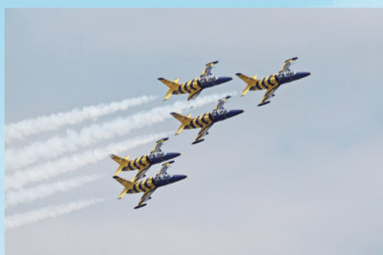
来自拉脱维亚的“波罗的海蜜蜂”(Baltic Bees)飞行表演队采用L-39作为表演机，蓝黄相间的蜜蜂涂装亮丽活泼。