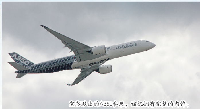
空客派出的A350参展，该机拥有完整的内饰。