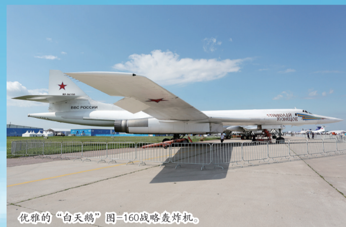
优雅的“白天鹅”图-160战略轰炸机。