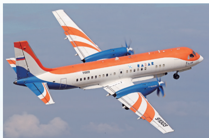
俄罗斯研制的伊尔-114涡桨支线客机进行飞行展示。