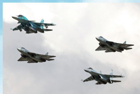
1架苏-34、1架苏-35和2架T-50组成四机编队进场，这三种机型都是苏霍伊公司的产品，也是俄罗斯空军当下和未来的主力机型。