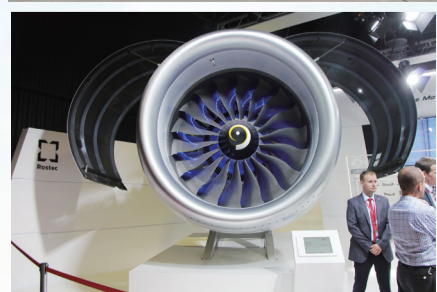
未来将用于MS-21的俄罗斯国产PD-14涡扇发动机。