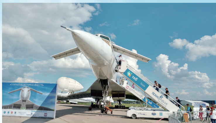
图-144超声速客机欢迎观众登机体验。