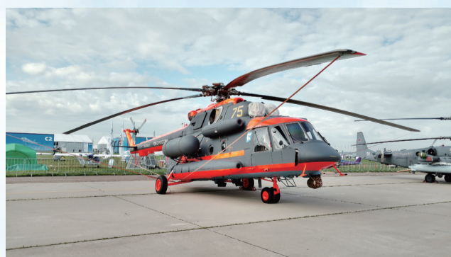
俄罗斯生产的北极地区专用型直升机。