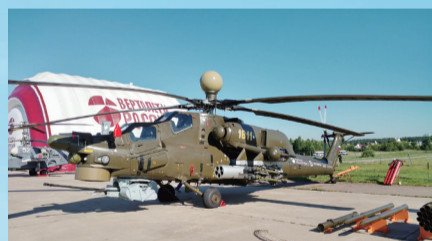
俄罗斯空军配备毫米波雷达系统的米-28N武装直升机。