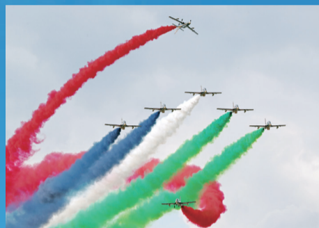
阿联酋空军的“骑士”表演队首次献艺莫斯科航展。