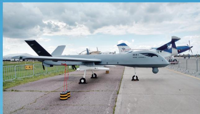
在静态展区展出的“翼龙”全尺寸模型。