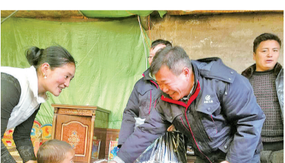
精准扶贫中开展慰问。