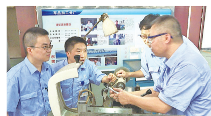
党员先锋队项目攻关。