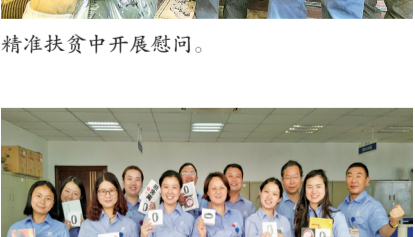
党建带工建团建 凝聚发展合力。