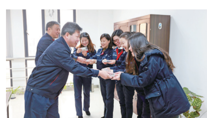
公司领导为职工送上节日慰问。

想政治工作制度，明确谈心谈话、情绪疏导、思想动态分析等日常思想工作具体要求，思想政治工作到一线、进团队。加强思想引领，组织开展“危机意识”、“工匠精神”和“责任担当”等主题讨论；围绕“创新”主题，开展征文、格言征集、主题微视频拍摄