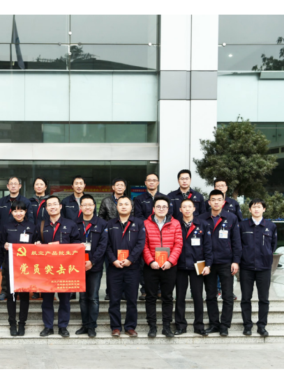
主题片、参观纪念馆、重温入党誓词、开展学习研讨等，淬炼党性，筑牢思想防线。2017年，也将积极开展建军90周年、党的十九大大召开等重大专项宣传活动。

2016年，成都所党委、各党支部结合纪念建党95周年和纪念长征胜利80周年活动，开展了各类主题教育活动，通过重走长征路、观看长征