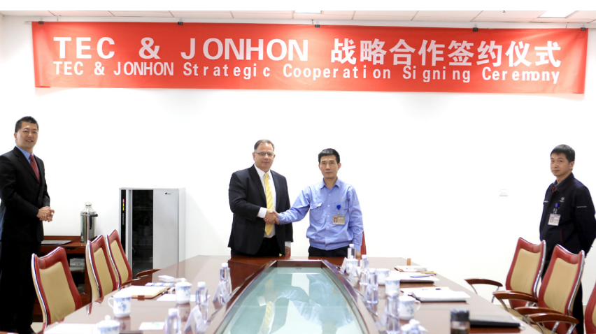
2014年10月15日，中航光电与世界连接器巨头泰科签订战略合作协议。

记者曾经对中航光电做过很多次追踪报道，与这位质量专家有深深的同感。在新一轮国企改革拉开大幕之际，记者又一次走进中航光电，且看且思考：中航光电的一些做法，也许能给新一轮国企改革一些启发。