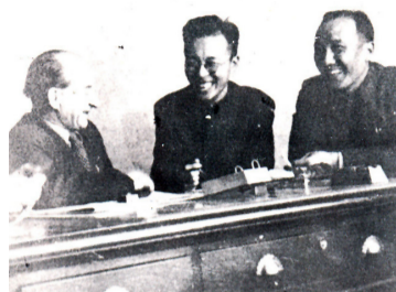
苏联专家指导工作

1951年3月,苏联开始派专家到111厂(现中航工业黎明)指导飞机发动机修理工作。当时正处在抗美援朝期间,战争要求工厂尽快掌握技术,多修发动机,以满足战争需要。