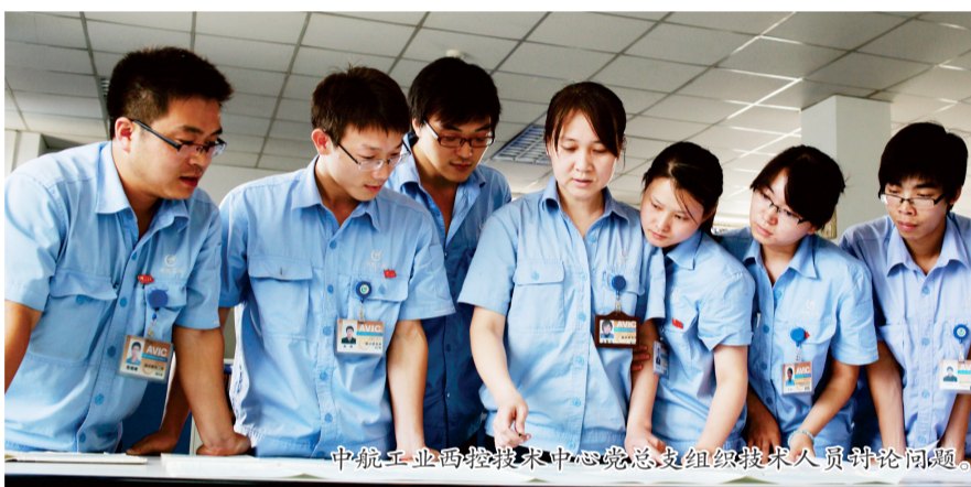
中航工业西控技术中心党总支组织技术人员讨论问题

本着宁缺毋滥的原则,技术中心发展党员坚持“成熟一个、发展一个”,每名入党积极分子都要通过“自我举荐、小组推荐、支委测评和群众调查”的层层考核,经支委会最终确定人选重点培养,从源头优化了党员队伍。党总支积极发挥党员模范作用,开