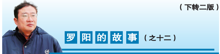
罗阳的故事(之十二)